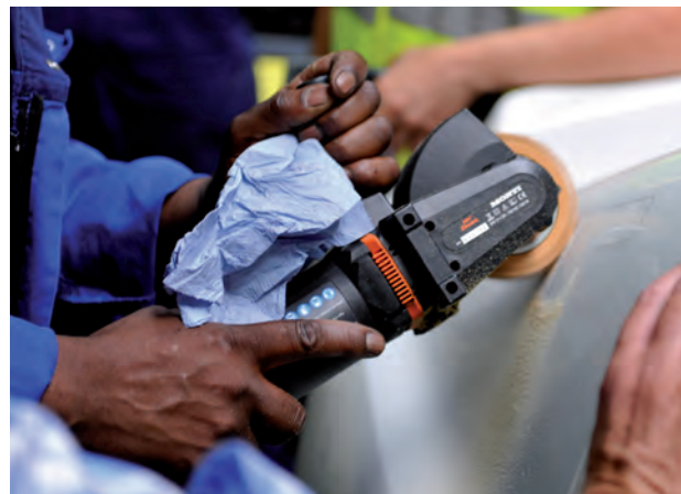
Met een vinylzapper verwijder je klein tekstwerk.