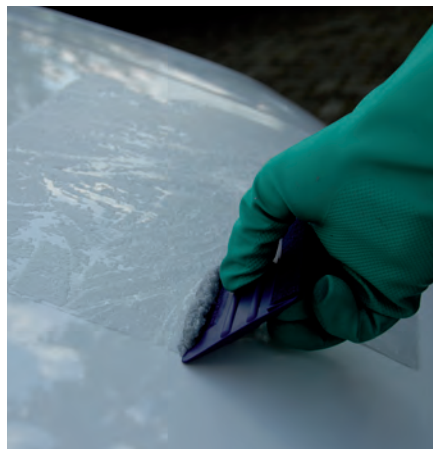
Juiste lijmverwijderingstechniek bespaart tijd.