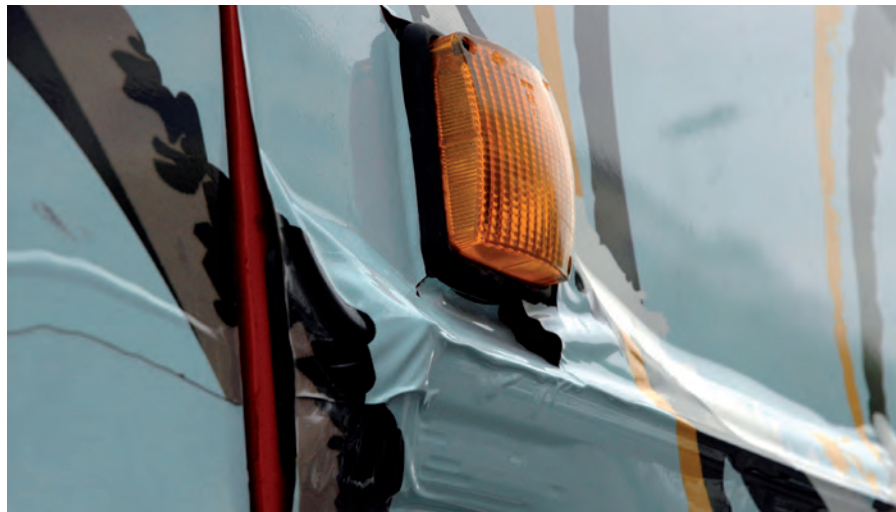
Oei. Zo moet het dus niet.

PU folie van 300 micron aan op de plaats waar je moet snijden. Breng hierover de (wrap)folie aan. Snijdt de wrapfolie op maat en trek het strookje PU folie er onder vandaan. Deze techniek is ontwikkeld tijdens het wrappen van straalvliegtuigen. Voordeel van deze techniek: niet duur, geen (minuscule) rafellijntjes op de snijlijn en ook toe te passen bij dikke folies, zoals beschermfolies.