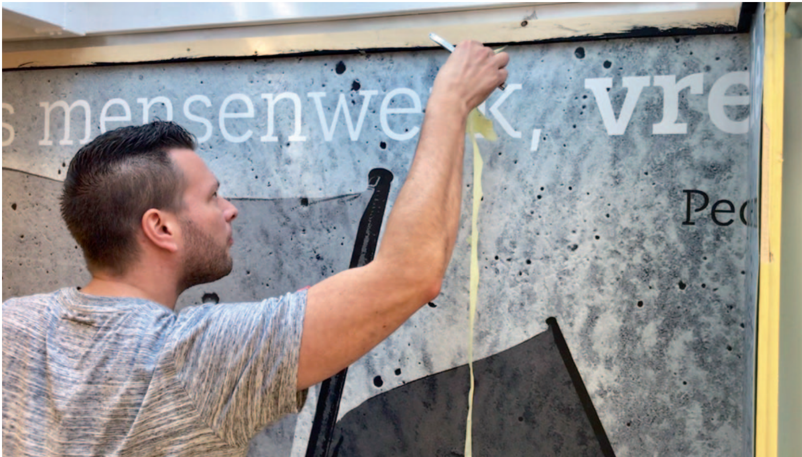
▲ Het behang is over het algemeen van geweven stevig textiel, dat vereist een specifieke snijtechniek.